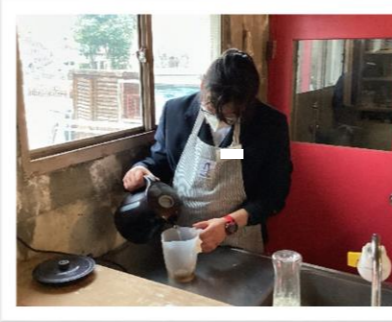
八寿園デイサービスとリモートで レクリエーションに取り組みました。