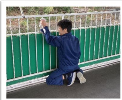
戸津池ゴルフセンター