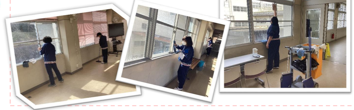
高等部福祉総合科

日頃は、本校の教育活動に御理解と御協力をいただきありがとうございます。 本校ホームページに掲載している「交流通信 YcY(わいわい)通信」の3学期総集編を発行します。 3学期も様々な団体の方に御協力いただき、児童生徒が生き生きと活動している様子をご覧ください!