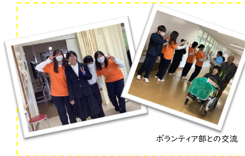
ボランティア部との交流