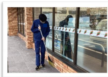
清掃活動を行いました。